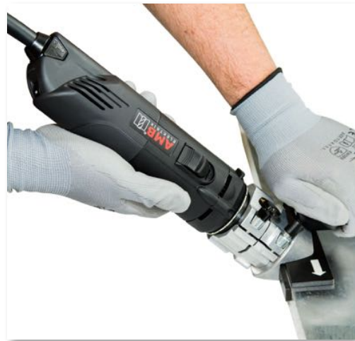
45° mobil sorjázás prizmával