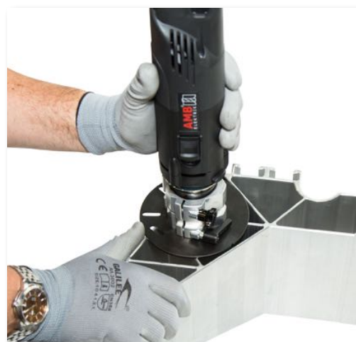
45° helyhez mobil sorjázás