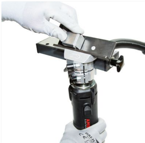
45° helyhez kötött sorjázás prizmával