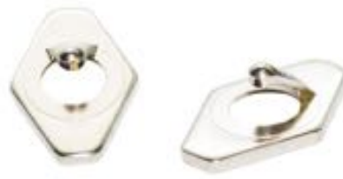
5 kontúrűtköző (4 db külön, 1 db a szabad forma feltétben)