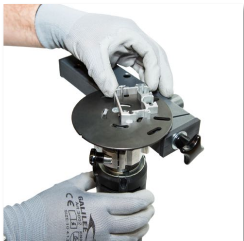
45° helyhez kötött kontúr sorjázás